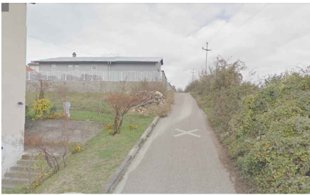
ПОГЛЕД ИЗ ул. РУДНИЧКЕ