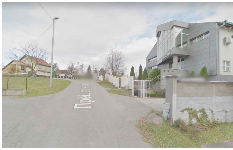
ПОГЛЕД ИЗ ул. ПРЕШЕРНОВЕ