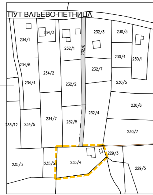
СКИЦА СЛУЖБЕНОСТИ ПРОЛАЗА