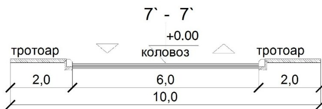
Попречни пресек саобраћајнице