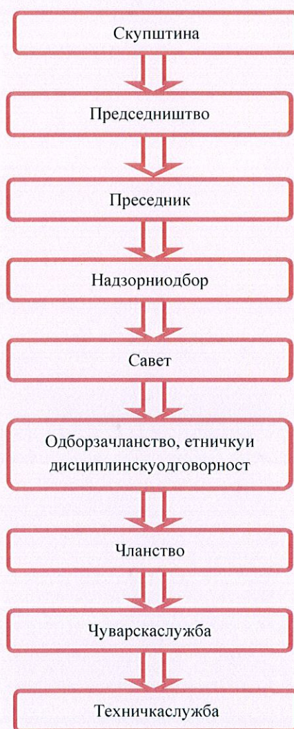
Слика 1. Шематски приказ