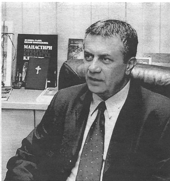
Zoran Jakovljević, gradonačelnik Valjeva

Zoran Jakovljević, gradonačelnik Valjeva, ističe: "Nameravamo da stvorimo posebne timove za praćenje realizacije ovih projekata, timove koji će stručno i odgovorno voditi i kontrolisati pomenute investicije. Osim toga, preko fondova, ministarstava, iz Nacionalnog plana i iz donacija tražićemo načine za njihovo finansiranje. Upravo zato, promena strukture privrede valjevskog kraja je neophodna. Poljoprivreda je oblast koja mora dobiti mnogo veći značaj. razvoj turizma kroz