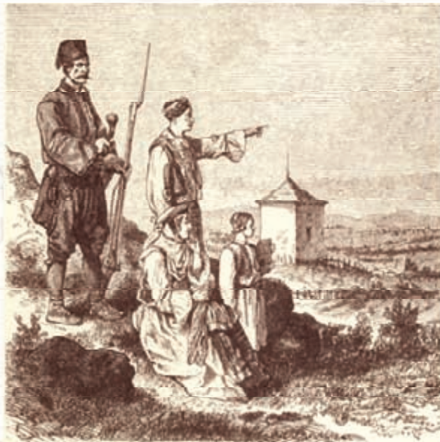
Ваљево, илустрације из књиге Феликса Каница "Србија – земља и становништво"