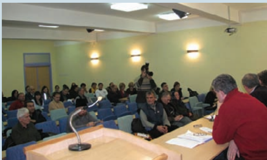
Јавна расправа о буџету

И ове године ће Град, у сарадњи са Националном службом, субвенционисати запошљавање за 100 суграђана. Социјална компонента буџета огледа се у чињеници да су издвојена четири пута већа средства за социјалну заштиту у односу на претходну годину. Обезбеђена су средства за одржавање и даље функционисање Дневног боравка за децу и младе са сметњама у развоју и Клуба за особе са инвалидитетом. Први пут су из локалног буџета опредељена средства за избегле и интерно расељене особе. Одржан је ниво улагања у школске установе, а повећана су издвајања за културу и спорт.