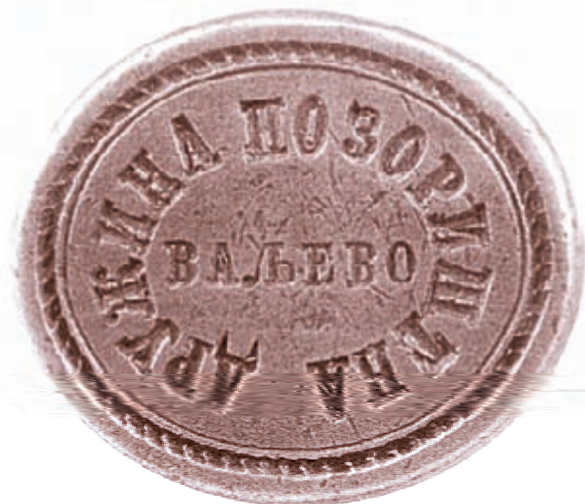
Печат првог ваљевског позоришта

Књига је одштампана у само 150 примерака, колико година броји позориште у Ваљеву.