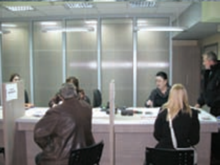
Бољи услови за грађане