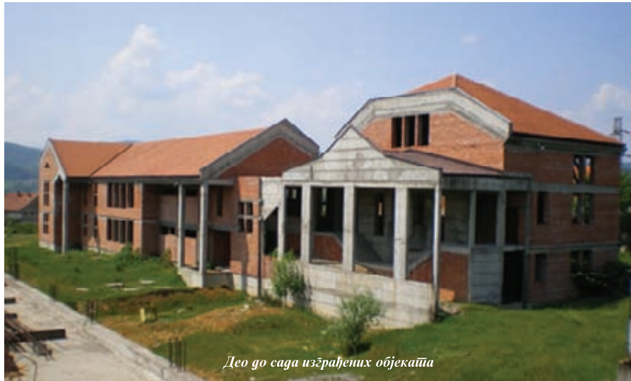
Део до сада изграђених објеката

Реална потреба за новим објектом основне школе „Милован Глишић“ у Брђанима постоји већ годинама. Стара зграда пројектована је и изграђена за 600 ученика. Међутим, број ученика који похађају ову школу већ одавно је превазишао тај лимит. Данас школа има преко 800 ученика распоређених у 36 одељења. Због неадекватног простора, није могуће реализовати кабинетску наставу, а изборна настава се спроводи између две смене. Такође, кров годинама прокишњава што представља сталну потенцијалну опасност да се оштете већ дотрајале електро-инсталације.