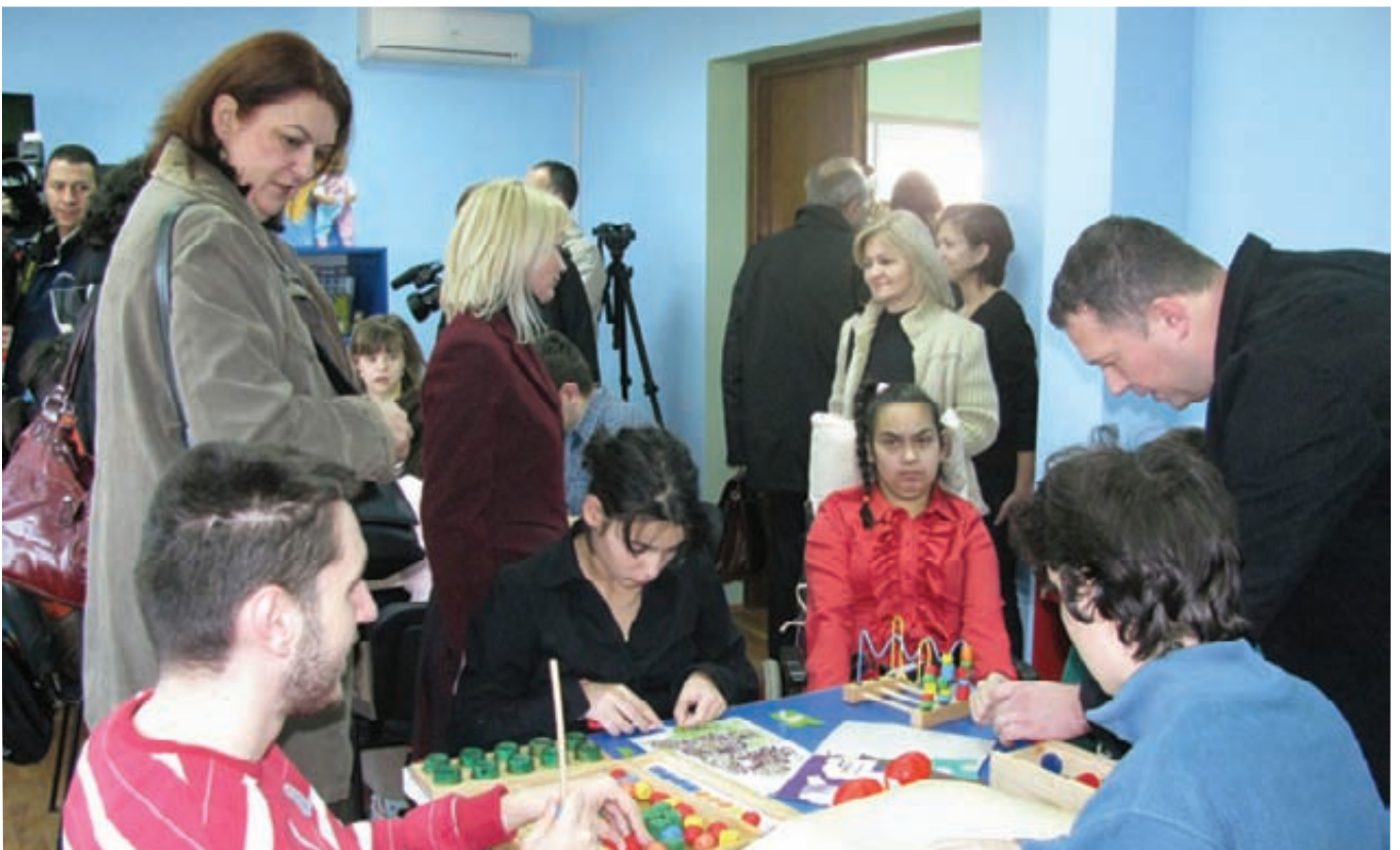
Друшћивене игре у Дневном боравку

Изградња Дневног боравка у Ваљеву одличан је пример сарадње Републике, локалне самоуправе и бизнис сектора. Петнаест милиона динара за ову инвестицију обезбеђено је тако што је Град Ваљево издвојио 6,6 милиона динара за успостављање и одрживост услуге, оперативне и друге трошкове, Министарство за рад и социјалну политику учествовало са 4,5 милиона, Министарство за државну управу и локалну самоуправу са милион динара, док је 2,8 милиона донирала Рајфајзен банка кроз Хуманитарни фонд "Будимир Бошко Костић". Град Ваљево је градским буџетом за 2010. годину предвидео око 5,2 милиона динара за функционисање Дневног боравка. О корисницима Дневног боравка брине невладина организација "Наши снови", која се дугогодишњим марљивим радом и квалитетним пројектима посвећеним младима са сметњама у развоју квалификовала за овај посао.