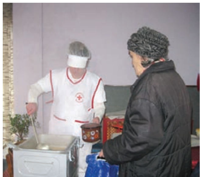
Поново топли оброк за угрожене грађане

Због великог броја грађана без икаквих примања или оних који имају мале пензије и на самој су граници сиромаштва, процена Црвеног крста је да су потребе Народне кухиње веће од 350 obroka дневно. Локална самоуправа планирала је обнову Народне кухиње за октобар прошле године, али то није реализовано због изостајања подршке Министарства за рад и социјалну политику, које се тада определило за градове на југу Србије. Народна кухиња у Ваљево затворена је 2004. после трогодишњег рада, када се из Србије повукао донатор - Црвени крст Немачке, а тадашња локална власт није преузела додатне обавезе.