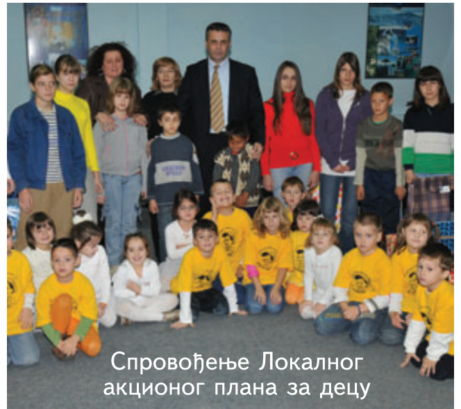
Спровођење Локалног акционог плана за децу