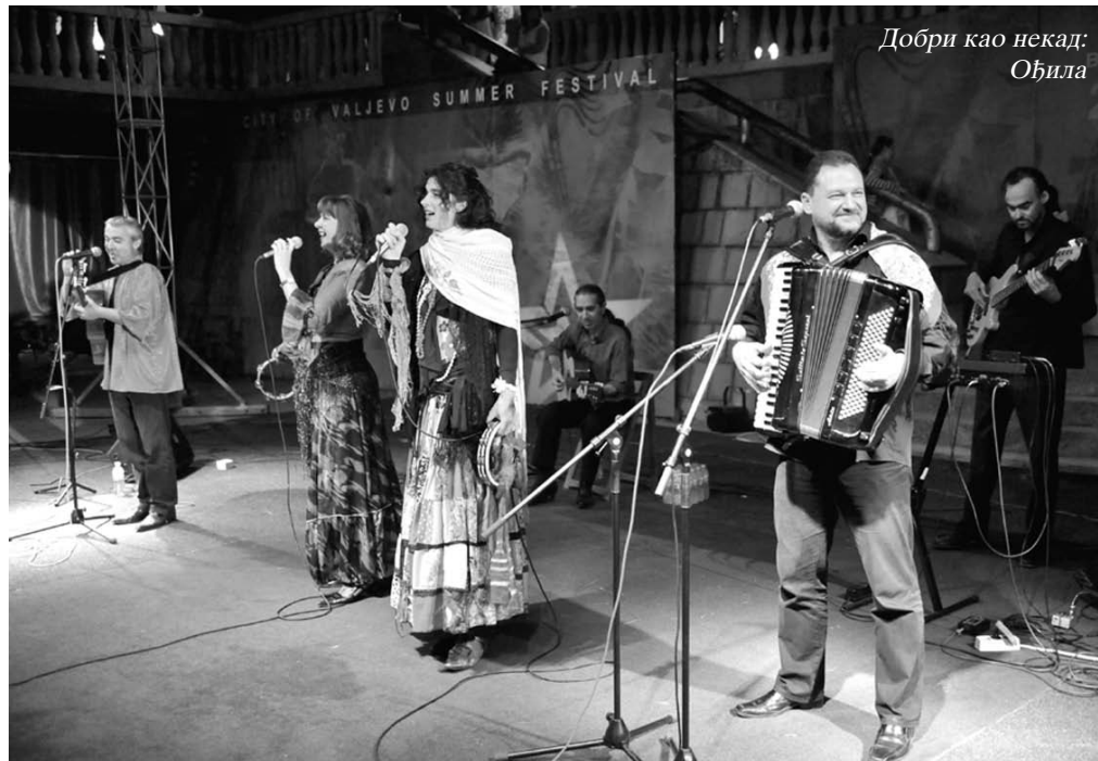
Добри као некад: Ођила

Програми на летњој позорници нису била једина музичка дешавања током ових Тешњарских вечери. Можда мање пом-