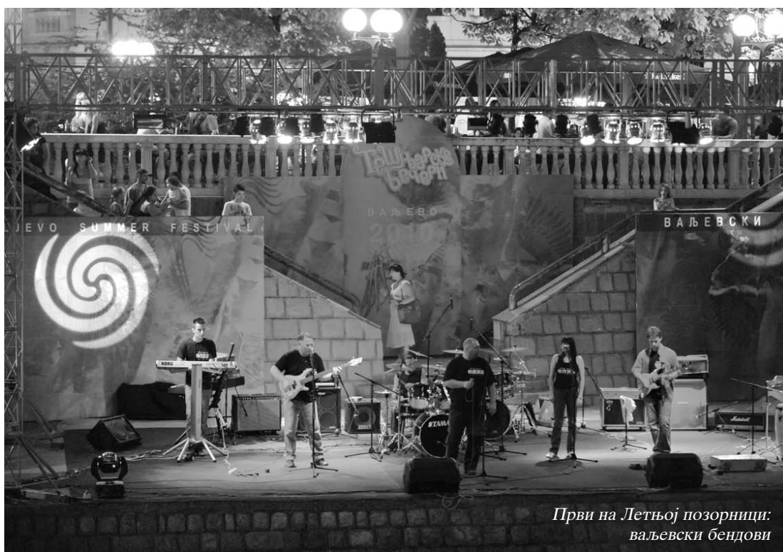
Први на Летњој позорници: ваљевски бендови